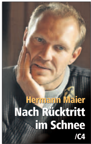
Hermann Maier Nach Rücktritt im Schnee /C4