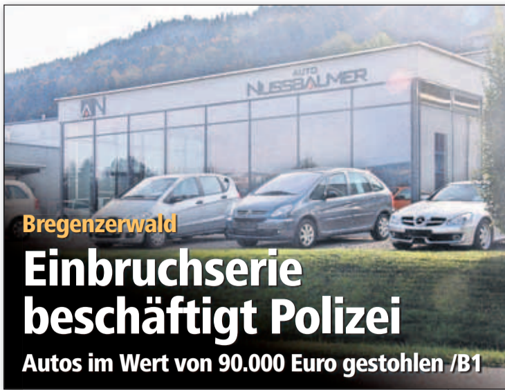
Bregenzwald Einbruchserie beschäftigt Polizei Autos im Wert von 90.000 Euro gestohlen /B1